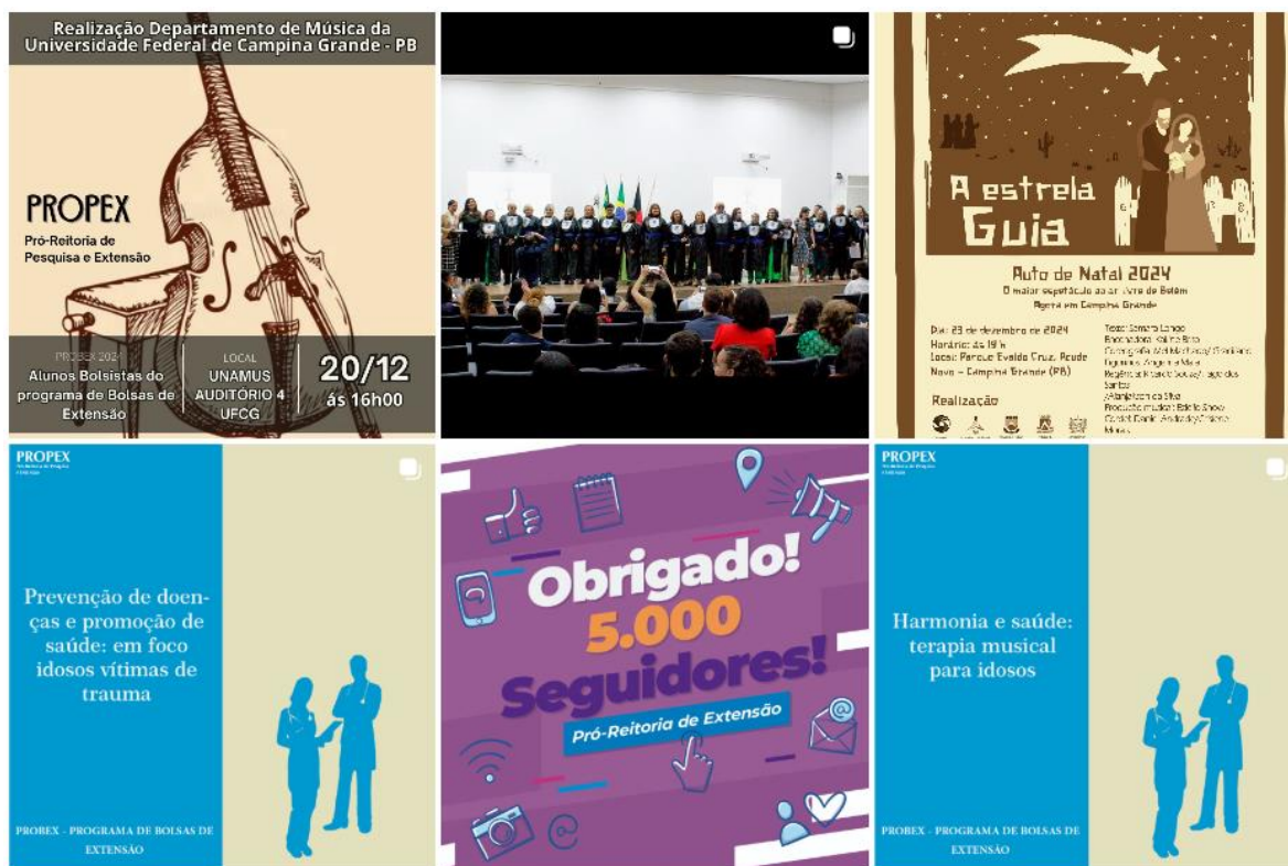
Figura 2. Recorte do trabalho de divulgação em Redes Sociais da PROPEX

Como resultado das ações destacamos a ampliação da comunidade de seguidores no Instagram da PROPEX, principal canal de socialização das atividades da Pró-Reitoria, atingindo a marca de 5 mil seguidores. A seguir apresentamos um gráfico de desempenho do perfil da PROPEX no Instagram gerado pela plataforma Meta Business.