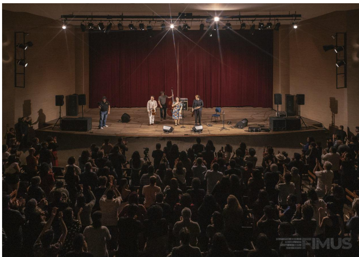
Figura 8. XV Festival Internacional de Música de Campina Grande

A CGAC atuou ainda no fortalecimento de grupos artístico-culturais da instituição, integrando-os em eventos e projetos de extensão como ENEX, Projeto Entardecer PROPEX, Festival Internacional de Música de Campina Grande – FIMUS e PROEXT-PG.