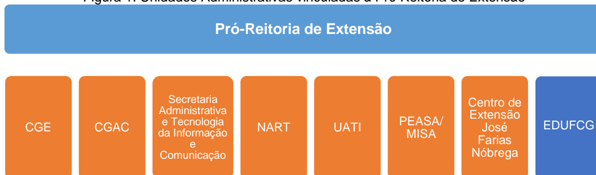
Figura 1. Unidades Administrativas vinculadas à Pró Reitoria de Extensão

A PROPEX estabeleceu durante o período de 2020-2024 parceira institucional com a Editora Universitária – EDUF CG para a promoção de publicações técnico-científicas, especialmente sobre a atividade extensionista na UFCG.