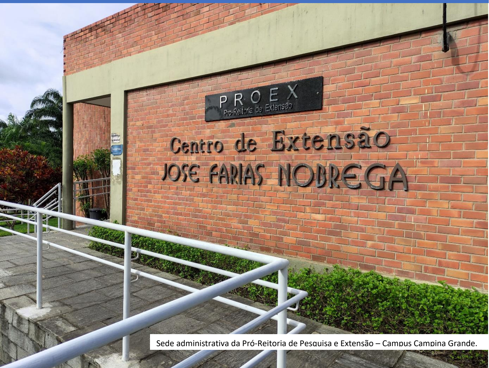
Sede administrativa da Pró-Reitoria de Pesquisa e Extensão – Campus Campina Grande.