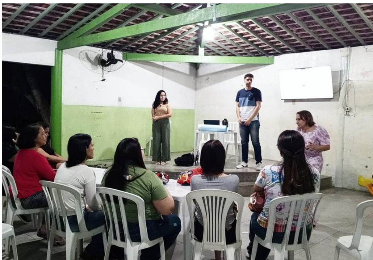
Figura 7. Programa de formação continuada para profissionais que atuam na rede pública de Educação Básica do município de Campina Grande - PROBEX 2024