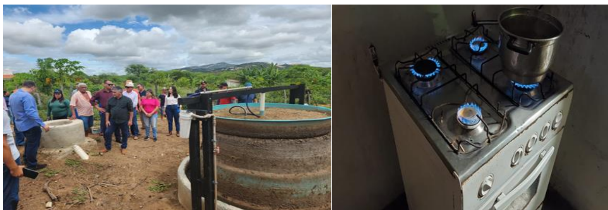
Figura 6. Implantação e Instalação de um Biodigestor pelo PEASA

Ações promovidas pelo Programa de Estudos e Ações para o Semiárido – PEASA destacam-se pelo seu forte relacionamento de parcerias com órgãos como SEBRAE, INSA e PaqTcPB, atuando junto às comunidades rurais e associações de produtores do Estado da Paraíba, promovendo o desenvolvimento sustentável da região.