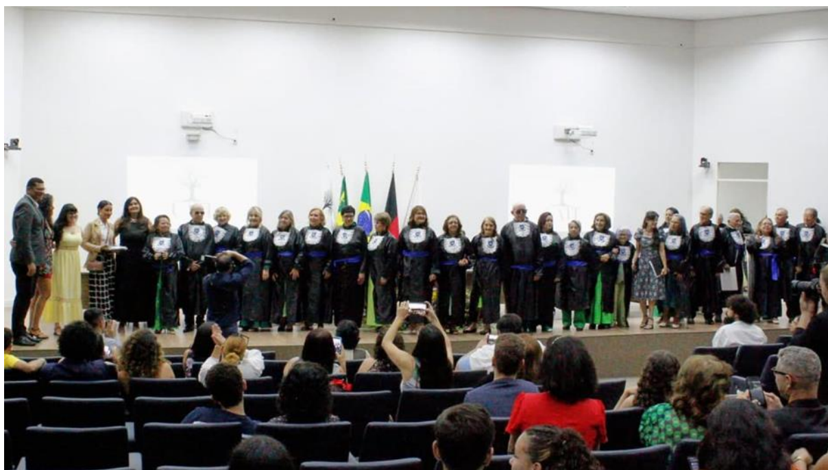
Figura 5. Formatura da 2ª turma de alunos da terceira idade da UATI realizada em 2024.

As atividades acadêmicas de extensão promovidas pela UFCG beneficiam um público diverso das comunidades interna e externa à instituição, em diversas cidades do Estado da Paraíba.