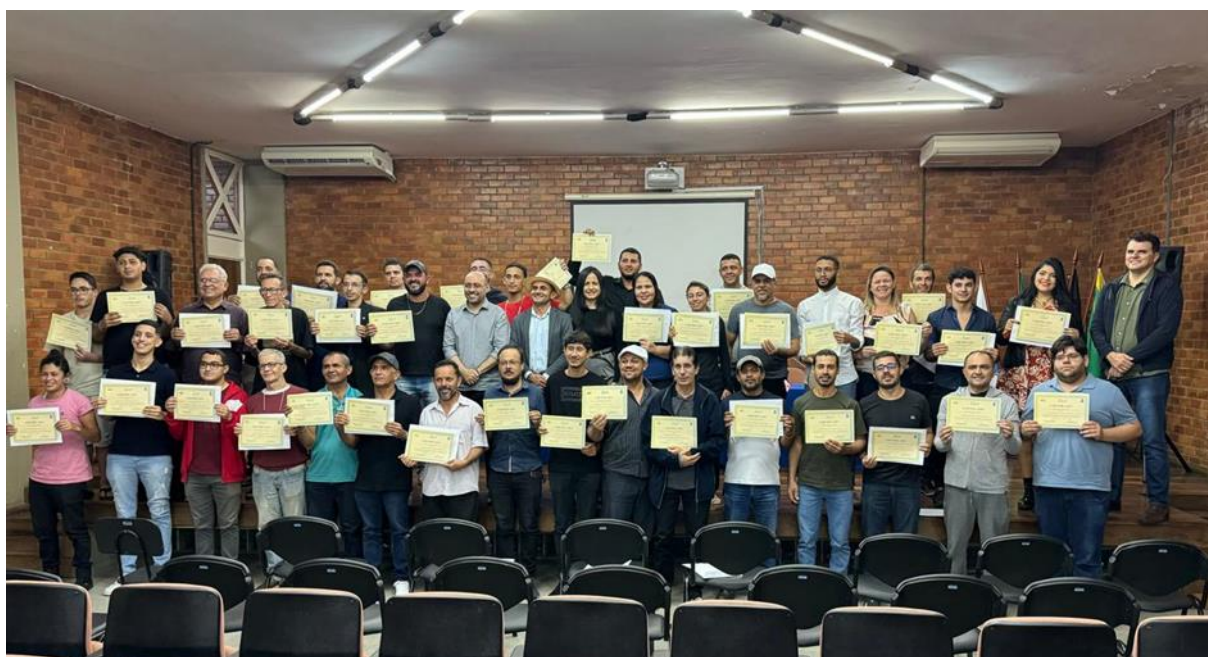
Figura 4. Primeira turma do Curso de Instalador de Sistemas Fotovoltaicos (PRONATEC/UFCG)

Os cursos foram realizados no período de 01/02/2024 a 02/04/2023, primeira turma, e a segunda turma no período de 04/03/2024 a 12/05/2024. No total, 60 estudantes concluíram o curso, sendo 54 bolsistas e 06 voluntários.